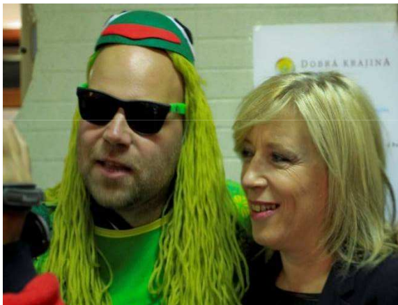
Borinský vodník s Ivetou Radičovou