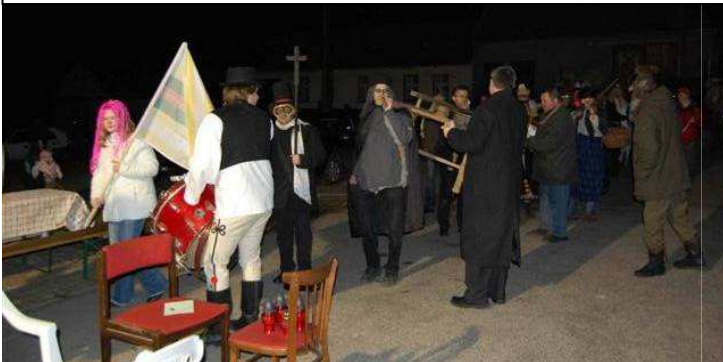
Fašiangový sprievod – pochovávanie basy v Borinke