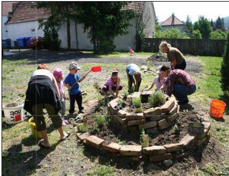
Deti pri tvorbe bylinkovej špirály – jar 2009