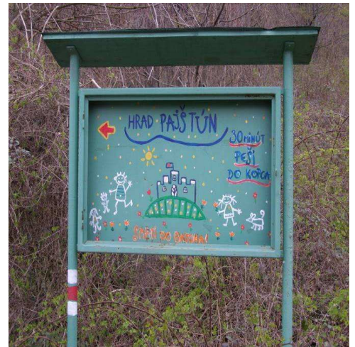
Tabuľa pri ceste k Pajštúnu