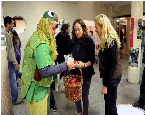
Prezentácia projektu v bratislavskom PKO – jeseň 2009