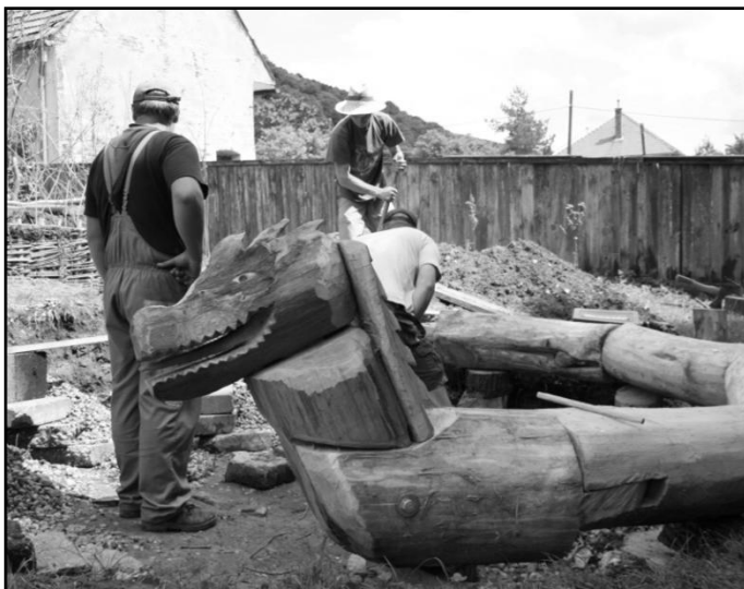
Drak čakajúci na piesok (už sa dočkal)