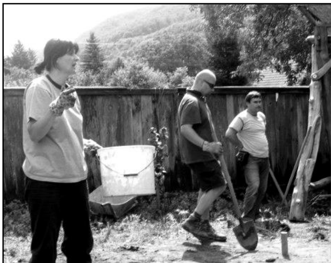
Pozdrav z letnej brigády