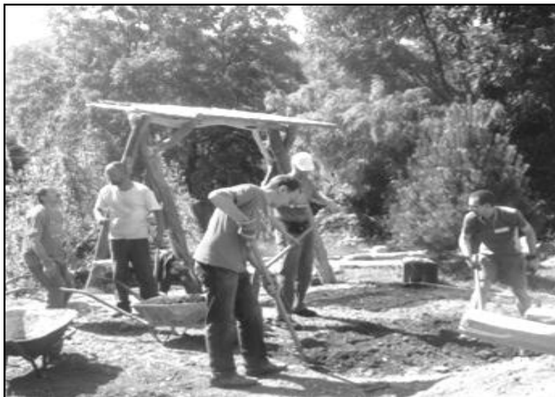
Takto vyzerá brigáda v plnom prúde...